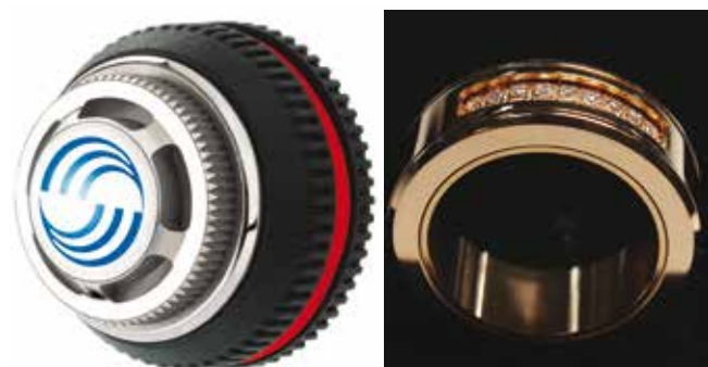
Exemple de couronne et de pièces de joaillerie (Cheval Frères).

En dépit d'une période perturbée ces derniers mois dans l'ensemble du secteur, le Groupe IMI revient cette année pour présenter ses plus récents développements. Avec ses dernières évolutions, Laser Cheval offre de nouvelles perspectives en mettant en lumière son laser femtoseconde.