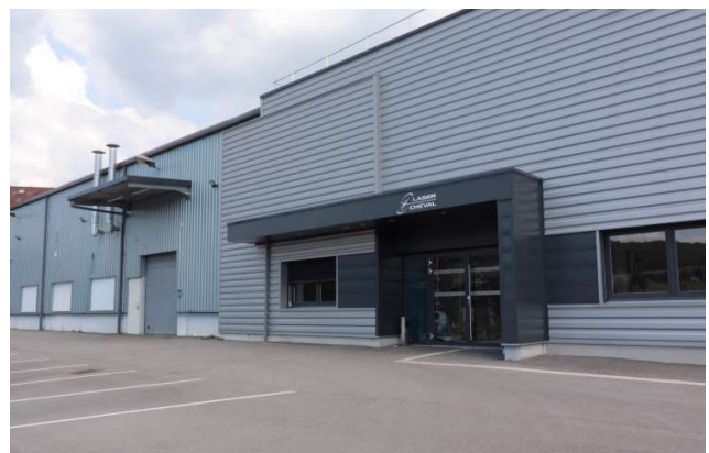
Siège de LASER CHEVAL à Marnay (France)