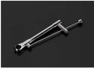
Micro-soudure - secteur médical