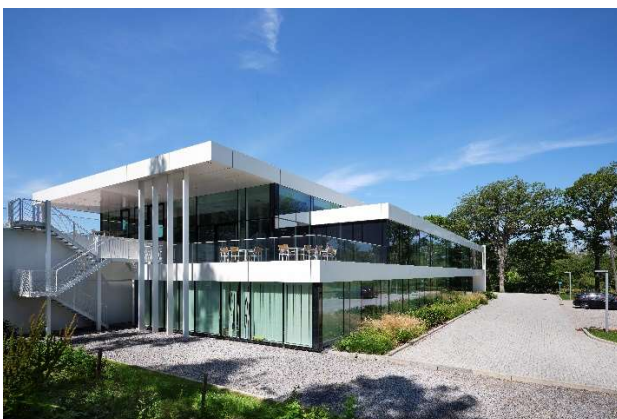
Siège de LASEA à Liège (Belgique)